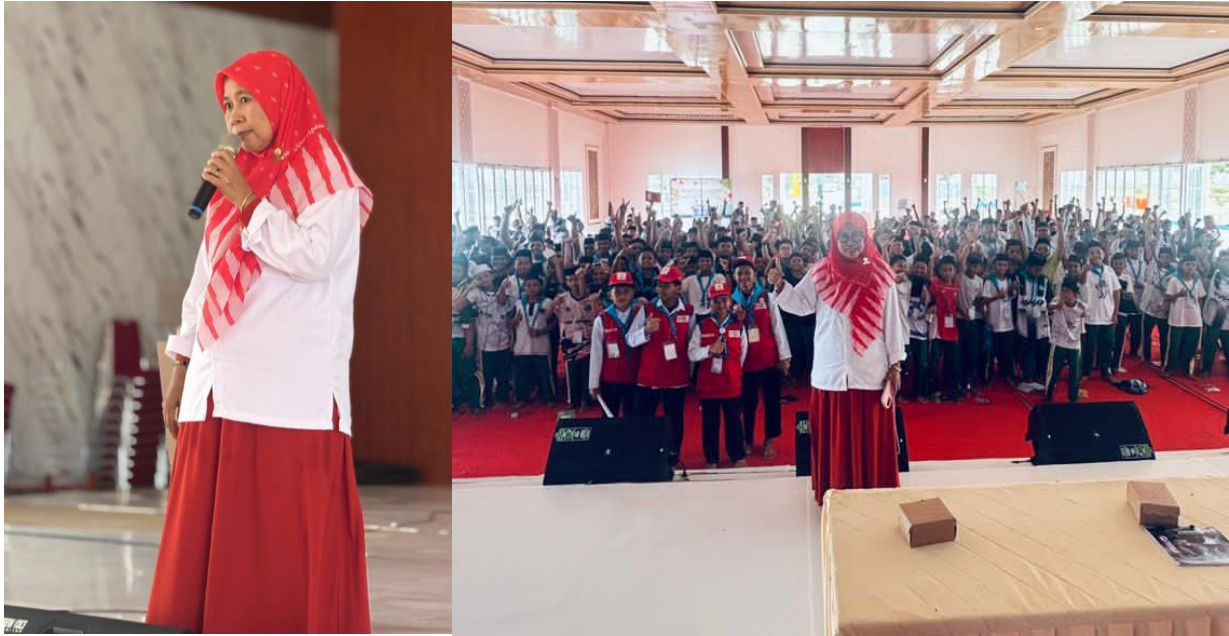
Gambar 2. Dokumentasi Kegiatan

pendaftaran dua pembina untuk mengikuti pelatihan fasilitator PMR di PMI Kabupaten Wajo, serta menyusun kalender kegiatan PMR Unit 015 untuk satu tahun ke depan bersama pengurus PMR yang baru dilantik. Pendekatan ini mencerminkan prinsip community ownership yang menjadi kunci keberlanjutan program pengabdian berbasis komunitas (Rosaline, 2019).